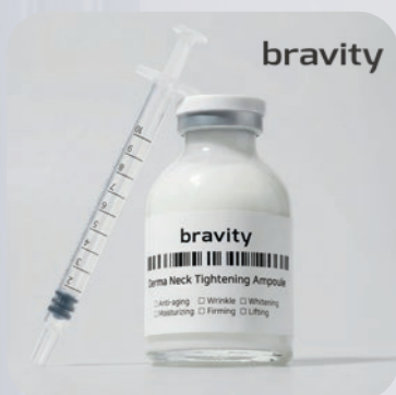
BRAVITY DERMA TIGHTENING NECK AMPOULE 30 ml