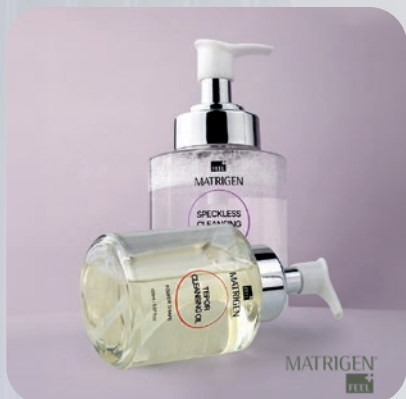
МИЦЕЛЛЯРНОЙ ВОДЫ Matrigen Speckless Cleansing Water