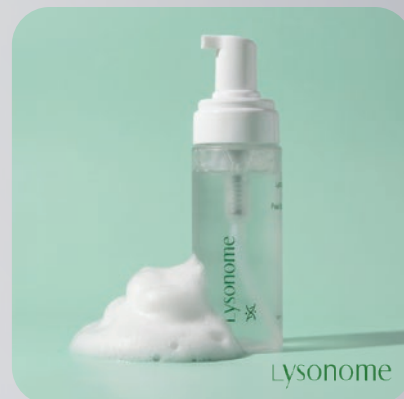
ПЕНКА ДЛЯ УМЫВАНИЯ С ДНК ЛОСОСЯ Lysonome PDRN Peak Bubble Foam