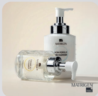
ПЕНКИ ДЛЯ ЛИЦА Matrigen Enigma All Cleanser