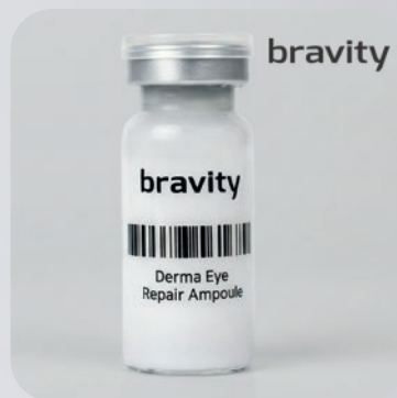
BRAVITY DERMA EYE REPAIR AMPOULE 10 ml