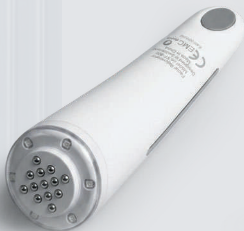
LIFETRONS RF-800 WB