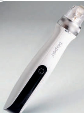
BIO PEN Q2