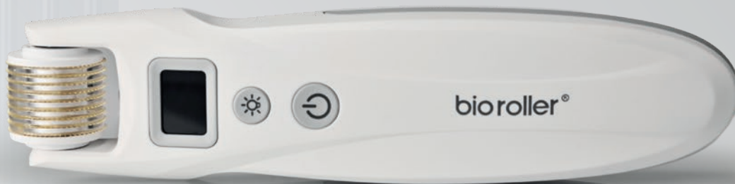
BIO ROLLER G5