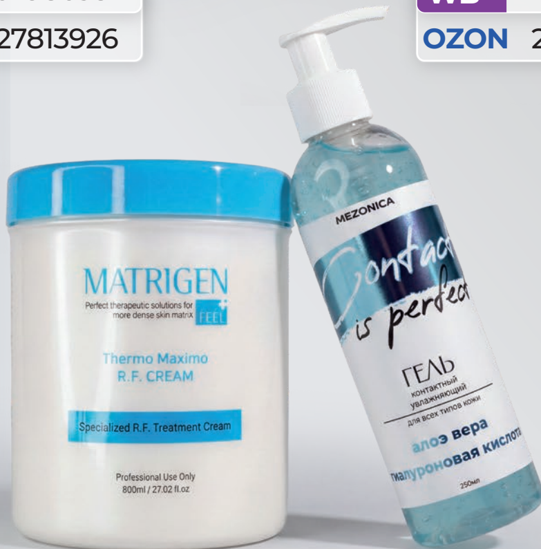
MATRIGEN КРЕМ ДЛЯ RF ЛИФТИНГА