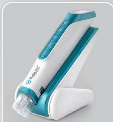
HYDRA PEN H6