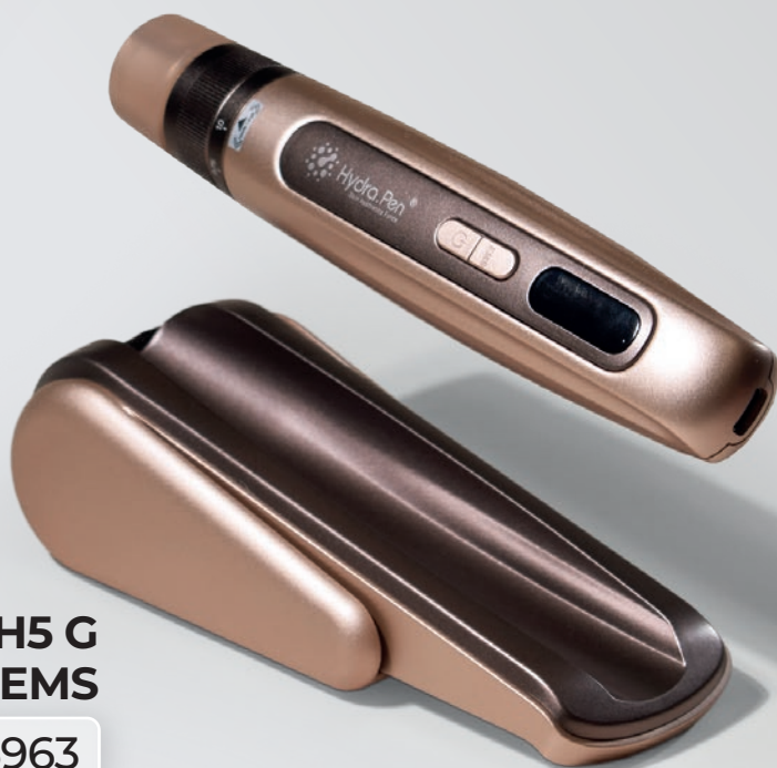
ДЕРМАПЕН HYDRA PEN H5 G С ФУНКЦИЕЙ EMS