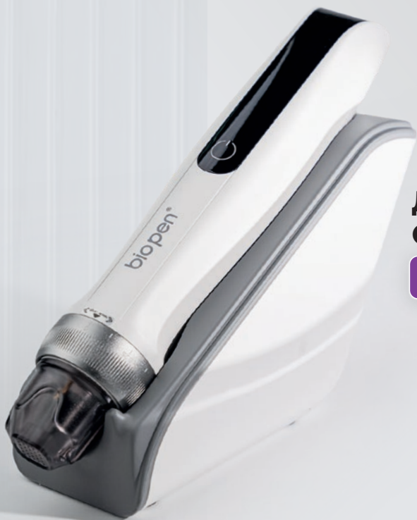
ДЕРМАПЕН BIO PEN Q2 С ФУНКЦИЕЙ EMS