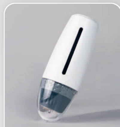
BIO NEEDLE H24