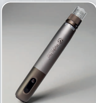
HYDRA PEN H3