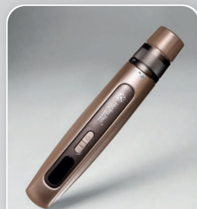
HYDRA PEN H5 G